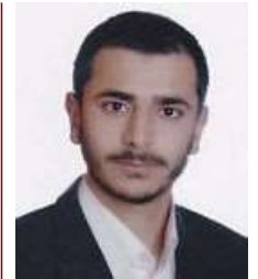
فلسفة التاريخ في التفاعلات الرمزية للعلاقات الاجتماعية

الى النهاية وحتى الظفر بالحرية والكرامة الانسانية. المجد والخلود للشهيد محمود والي الجزى والعار لعصابة بشار الأسد ومرزقتها. الجمعية الكوردية للدفاع عن حقوق الانسان في النمسا جمعية جلادت بدرخان للثقافة الكردية منظمة ازادي للدفاع عن حقوق الكورد الانسانية0موسكو جمعية ماردين حسكة 20.09.2012