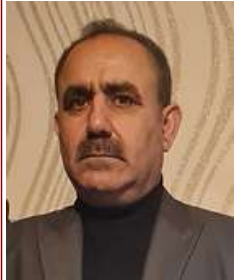
«خاني» حي بيننا