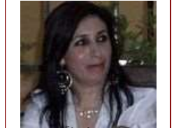
ختان تلمع الأخذية؟