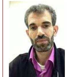
ساعة من أجل تلك الشاعرة