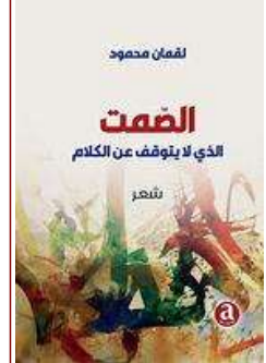
الشاعر الكوردي لقمان محمود والصمت الذي لا يتوقف عن الكلام