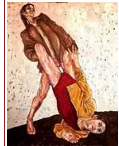
بونيس السيد يحاصر السطوح لينتقل إلى غورها