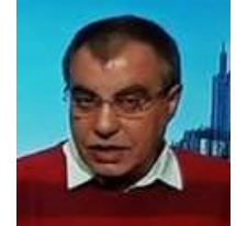
في عينك كل الجمال نصفل