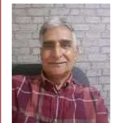
جردة حساب في ليلة رأس السنة 2023 !!؟