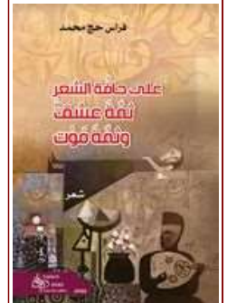
صودر ديوان «على حافة الشعر: ثمة عشق و ثمة مون»