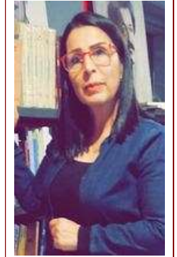
«بين الغائب والقادم»