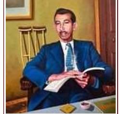
مع بدر شاكر السياب في ذكرى الحياة والموت