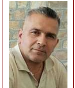
تجنب مخاطر الحسد