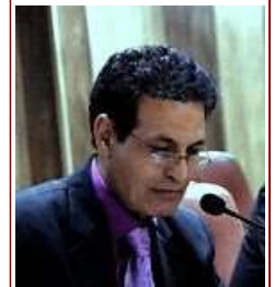
مصادفة المصادر التاريخية، (حصار انطاكية) بين ابن العديم والكاتب الصليبي المجهول