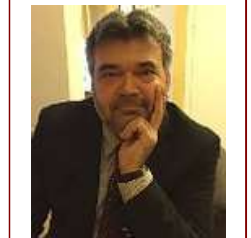
القصة القصيرة في الأدب السويدي