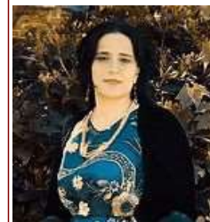
كبرياء المرأة الشامحية