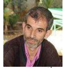
في تأمل تجربة الكتابة.. منع الغرباء من التعليق على منشورات الغيسبيوك